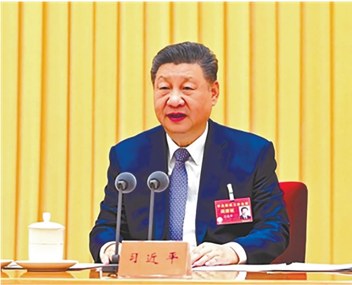
12 月 10 日至 11 日,中央经济工作会议在北京举行。中共中央总书记、国家主席、中央军委主席习近平出席会议并发表重要讲话。