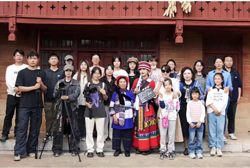
青年瞭望号团队赴石林阿着底村拍摄纪录片《再唱阿诗玛》