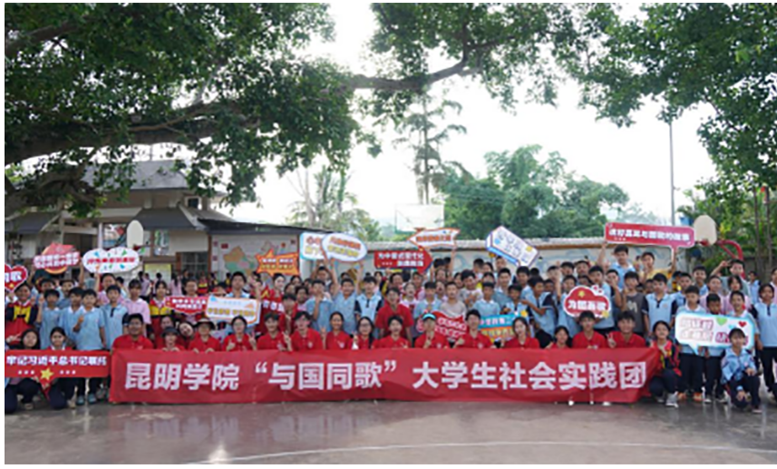
组织开展“三下乡”暑期社会实践