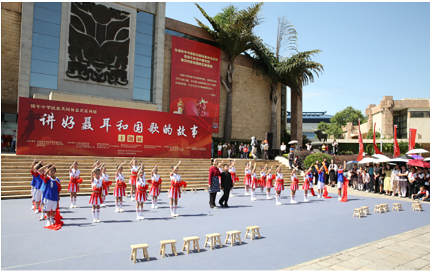
举办“讲好聂耳和国歌的故事”铸牢中华民族共同体意识作品展

一是勇担生态文明建设使命。围绕云南“生态文明建设排头兵”定位，学校发挥学科优势，建设滇池流域生态文化博物馆，制作科普视频与手绘地图，将其打造为重要的区域性生态文明教育平台，获评“全国生态文明教育特色学校”。二是投身乡村振兴广阔天地。深入践行“把论文写在祖国大地上”的号召，获批建设包