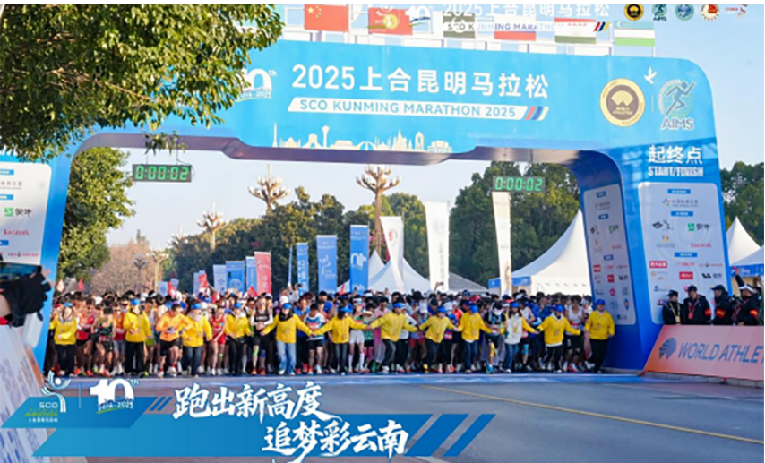
学校青年志愿者在上合昆明马拉松服务