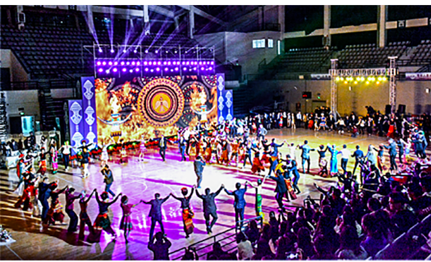
举办上合国家青年文化交流晚会