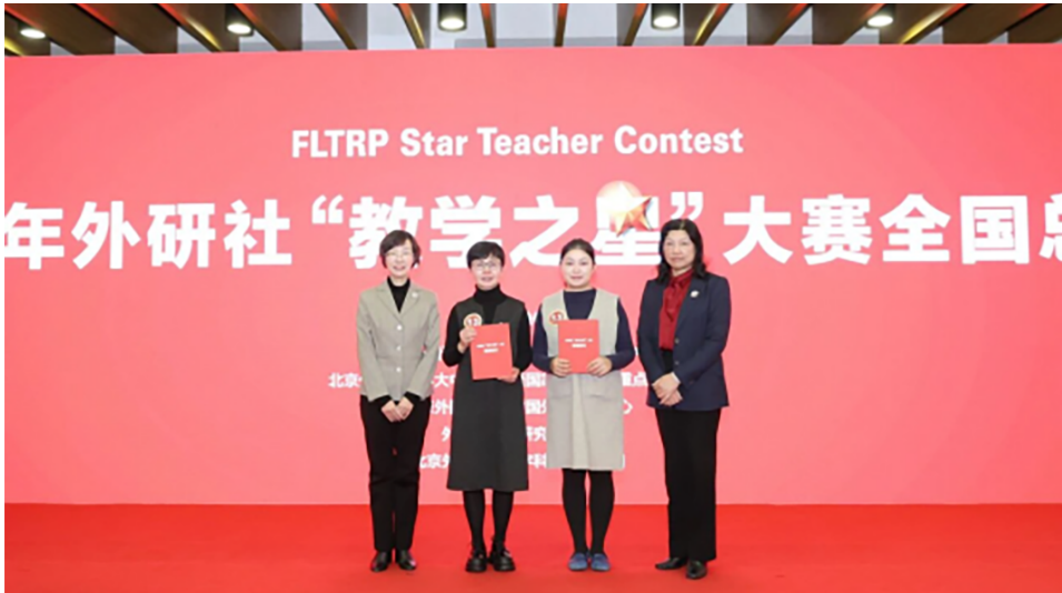
外国语学院教师团队获 2025 年外研社“教学之星”大赛 全国总决赛冠军

2025 年,学校以教育部本科教育教学审核评估整改为契机,锚定应用型人才培养目标,以数智赋能深化教学改革,以产教融合凝聚育人合力,以成果导向健全工作机制,在专业建设、课程创新与学生发展等方面取得突破性成效,书写了人才培养的新篇章。