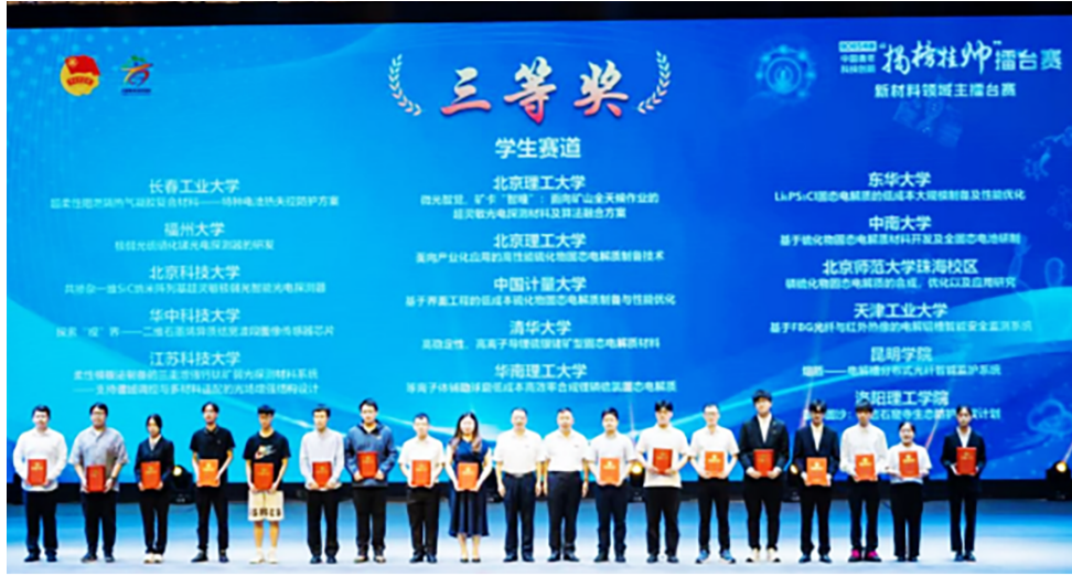
化学化工学院学生获“挑战杯”全国大学生课外学术科技作品竞赛 三等奖