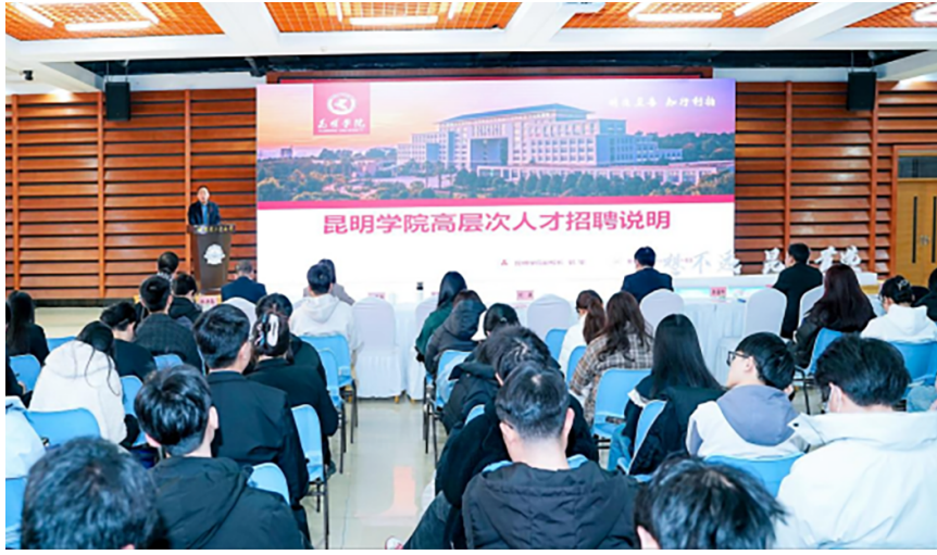
组织参加昆明市全国引才活动