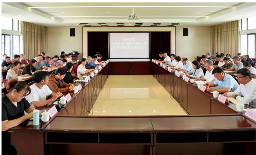
召开银龄教师座谈会