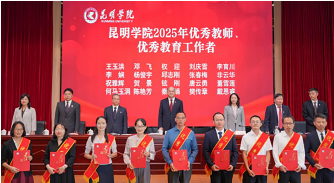
表彰先进集体和个人

近年来,学校坚持党管人才原则,高度重视教师队伍建 设,坚持实施“人才强校”战略,落实师德师风第一标准要求, 以教育家精神铸魂强师行动为引领,以师德师风铸魂、引才聚智、 培优成长、改革增效为抓手,为建设特色鲜明的综合性应用型