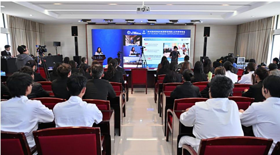
旅游学院专业完成联合国世界旅游组织教育质量认证

专业质量持续提升,3 个专业完成联合国世界旅游组织教育质量认证,2 个工程类专业积极推进德国 ASIIN 国际工程认证,专业国际影响力不断增强。在中高本贯通方面,烹饪与营养教育专业获批“3+4”中本贯通试点,音乐表演专业开展“3+2”高本贯通培养,促进了职普融通。学校还率先开展微专业建设,首批开设 7 个微专业,选课学生 360 人,拓展了学生