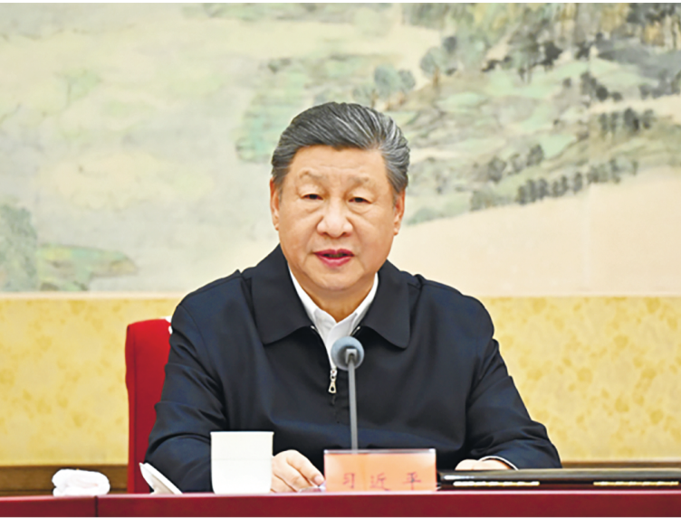
12月25日至26日，中共中央政治局召开民主生活会，中共中央总书记习近平主持会议并发表重要讲话。

中共中央政治局召开民主生活会强调 锲而不舍落实中央八项规定精神 以优良作风凝心聚力真抓实干 中共中央总书记习近平主持会议并发表重要讲话