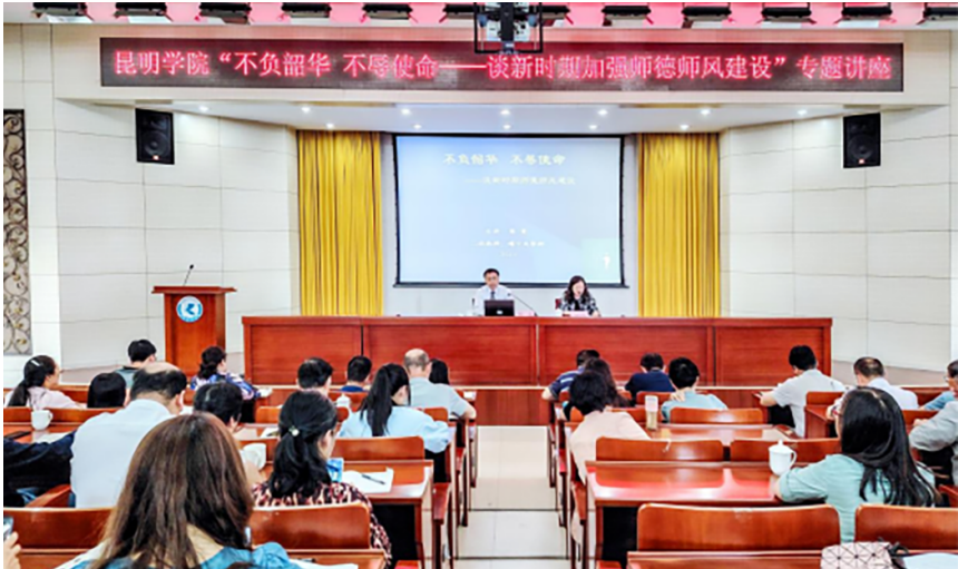
举办师德师风专题讲座