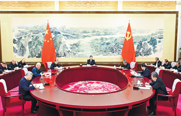
12月25日至26日，中共中央政治局召开民主生活会，中共中央总书记习近平主持会议并发表重要讲话。